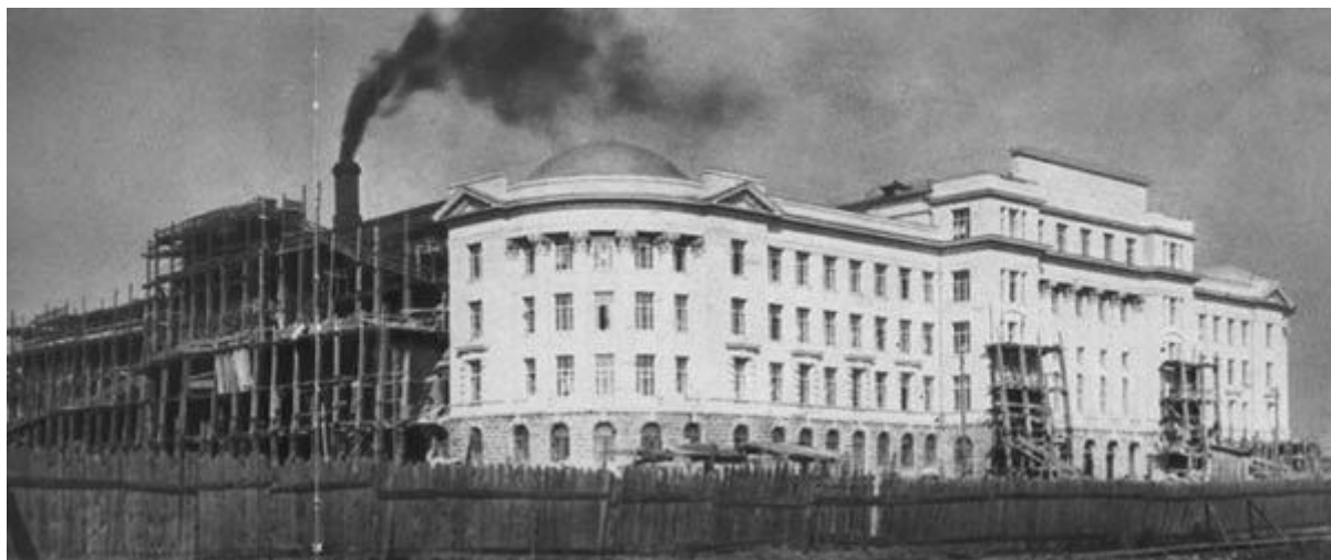
Управление Пермской (Свердловской) железной дороги по улице Северной (улица Челюскинцев). 1928.

дыра, преисподняя, как будто у города нету «сегодня», а только — «завтра» и «вчера».